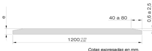
Cotas expresadas en mm.

Consultar el Manual del Instalador Placo®.